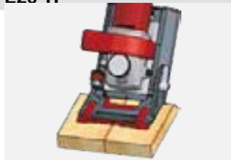
1. Сделайте паз