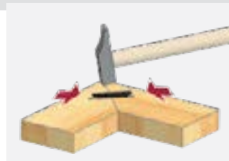
3. Забейте E 20-L