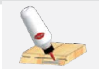
2. Нанесите клей