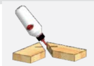
2. Нанесите клей