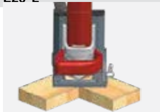
1. Сделайте паз