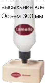
Minicol: тьюбик для нанесения клея с устойчивой деревянной подставкой.