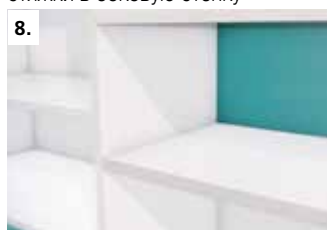
8. Прочное и полностью скрытое соединение!