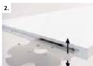
2. Отфрезеруйте паз P-System