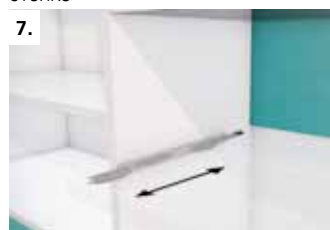
7. Зафиксируйте полку