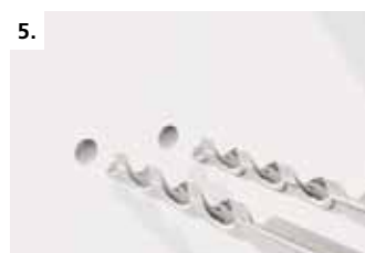
5. Присадите отверстия в боковой стенке