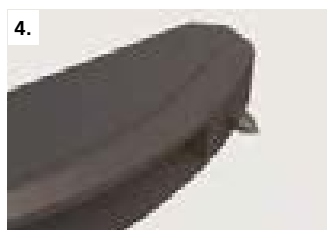
4. Забейте направляющие штифты