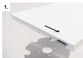
1. Отфрезеруйте продольный паз в полке