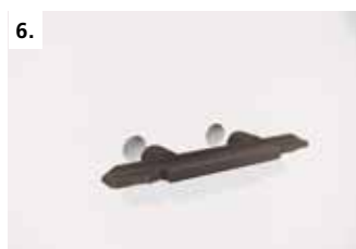
6. Установите ответную часть стяжки в боковую стенку