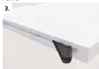
3. Установите стяжку в полку