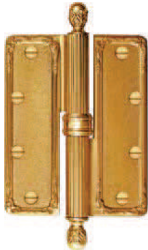
CC5X4 BA 102x175