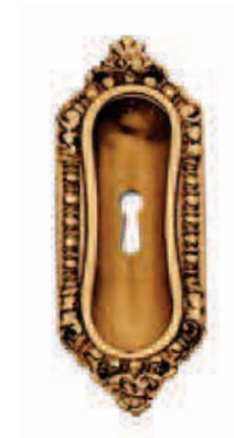
C50400 FC 43x108