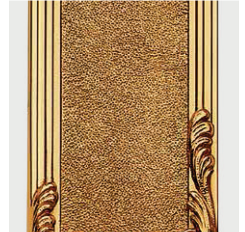
BOCCIARDATURA La bocciardatura è una lavorazione superficiale che crea una superficie leggermente corrugata, apprezzata per le sue valenze chiaroscurali.

BUSH HAMMERING Bush hammering is a process that creates a lightly pleated surface, appreciated for its light and shade effects.