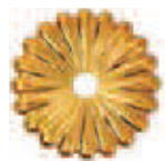
Bagno Oro PVD Gold PVD COD. f