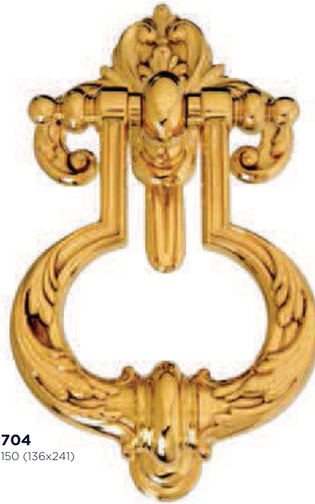
704 150 (136x241)