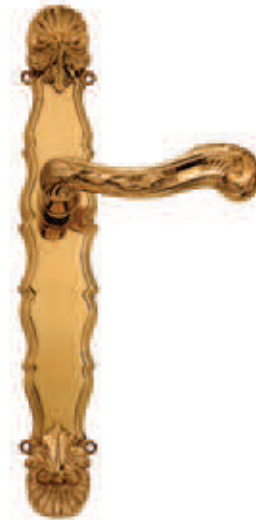
C043 P. 19