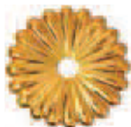
Bagno Oro Gold Plated COD. X