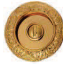
C507AC Ø 64