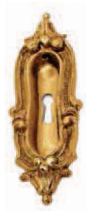
C50500 FC 41x116