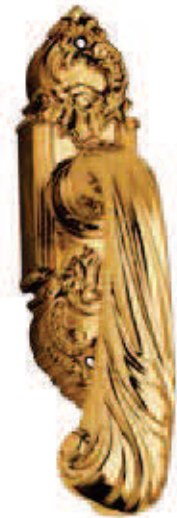
C12010 DK 37x175