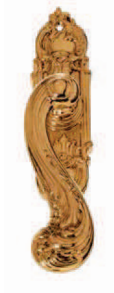
C01210 DK 41x170