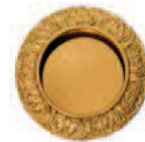
C50700 Ø 64