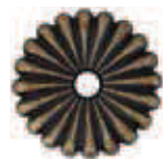
Bronzo Scuro Opaco Matt Dark Bronze COD. BSO