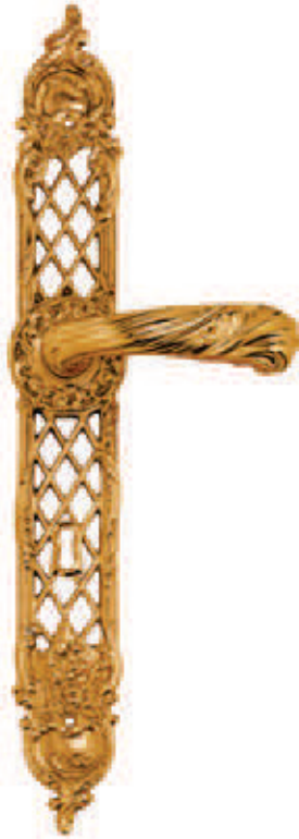
C019 P. 8