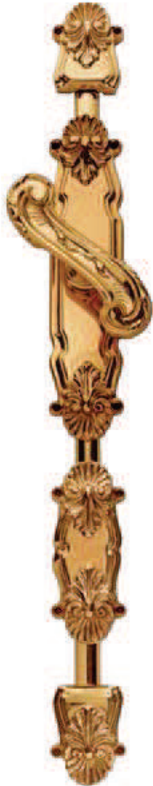
C31901 Asta C319AS non inclusa nella confezione Rod C319AS is not included in the package