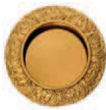
C50700 Ø 64