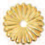
Oro Non Verniciato* Polished Brass Not Lacquered* COD. G