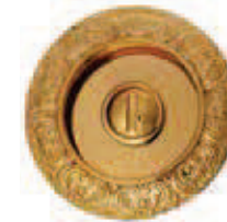
C507AC Ø 64