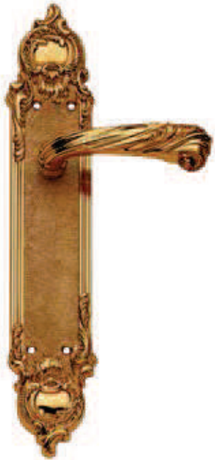
C120 P. 7