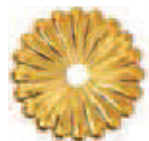
Oro PVD Polished Brass PVD COD. U