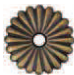
Bronzo Antico Antique Bronze COD. B