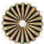
Oro Imperiale Imperial Gold COD. j