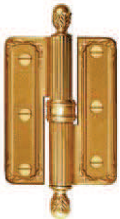
CC4X3 BA 76x150