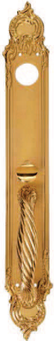
C40010 65x450 145x330