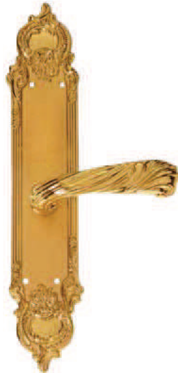
C40010 D 65x450 145x330