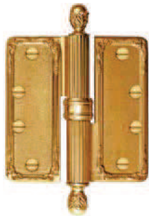
CC4X4 BA 102x150