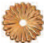
Oro Antico PVD Old Gold PVD COD. g