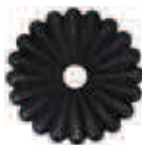
Ottone Antico Ancient Brass COD. P